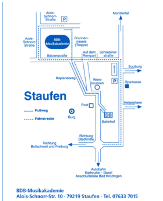
Lageplan und Seminaranschrift